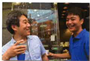
※高円寺阿波踊り模擬店出店の様子

離職率(5年後離職率5%以下)の少なさが居心地の良さを物語っているといえます。厳しさの中において、製造業特有の縦社会の雰囲気はなく、上下、先輩後輩とも何でも相談できる雰囲気が作られております。年に数回各職場で模様される懇親会(参加率がとても高い飲み会)、バーベキュー、夏場の高円寺阿波踊り時の模擬店など、とても楽しく皆さん参加されております。